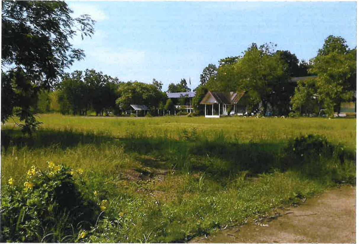
สนามกีฬาบ้านนาขาม หมู่ ๔ ตำบลวังยาง