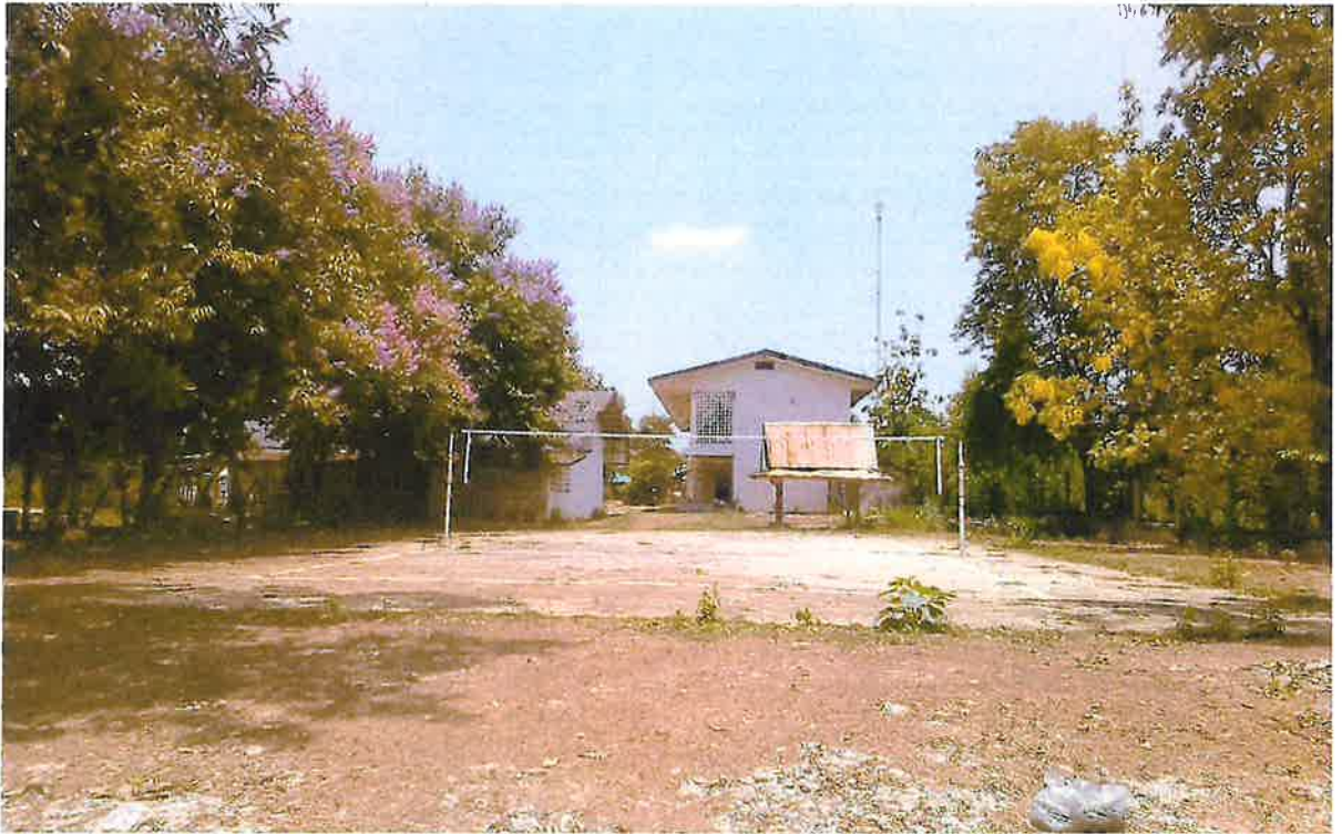
สนามกีฬาบ้านหนองแหน หมู่ ๑ ตำบลหนองโพธิ์