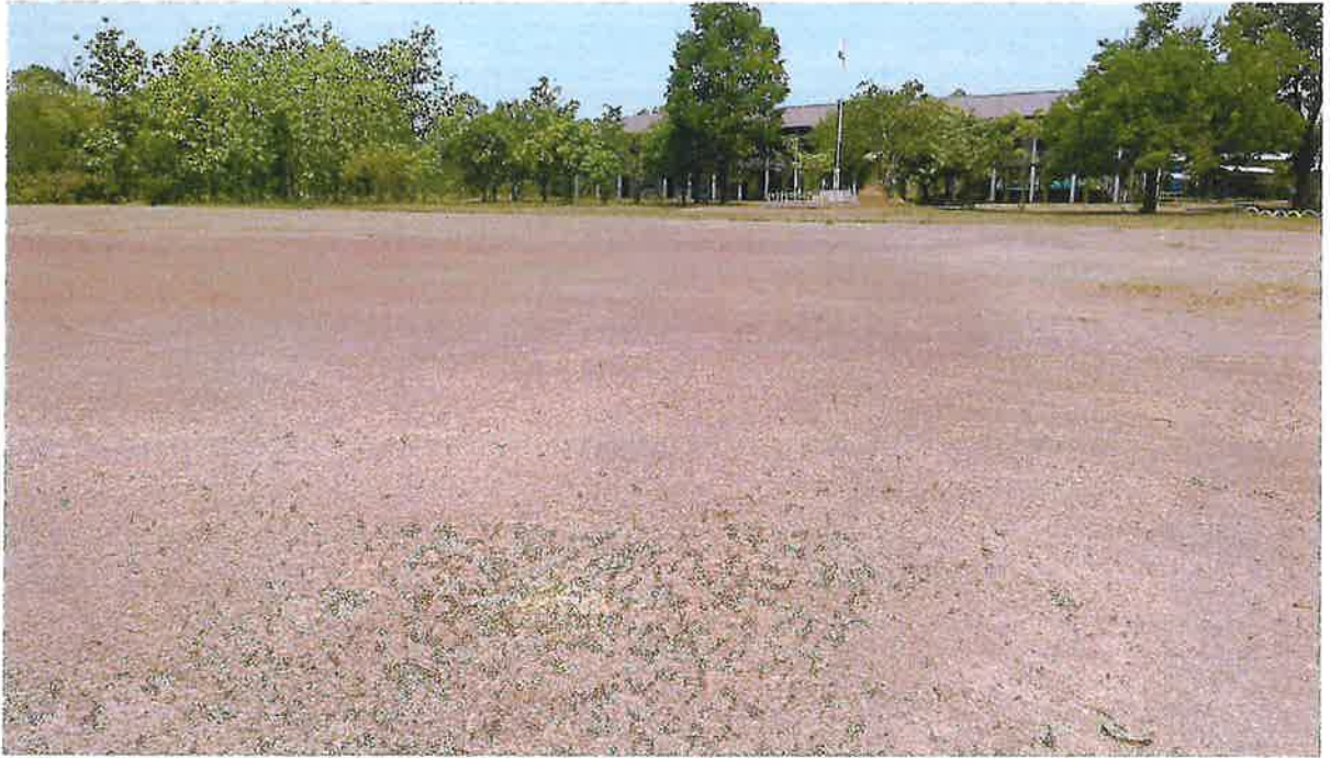
สนามกีฬาบ้านหนองนางต่อน หมู่ ๒ ตำบลวังยาง