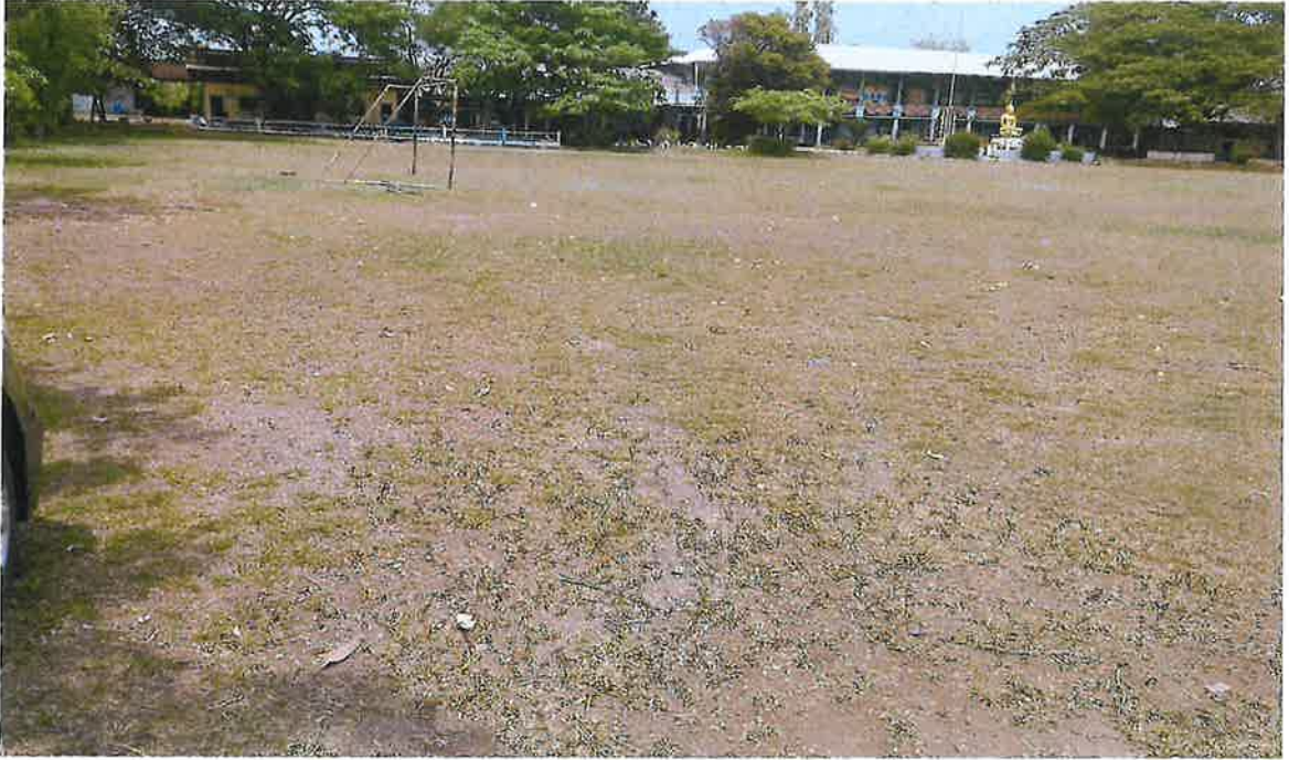
สนามกีฬาบ้านนาสมบูรณ์ หมู่ ๘ ตำบลวังยาง