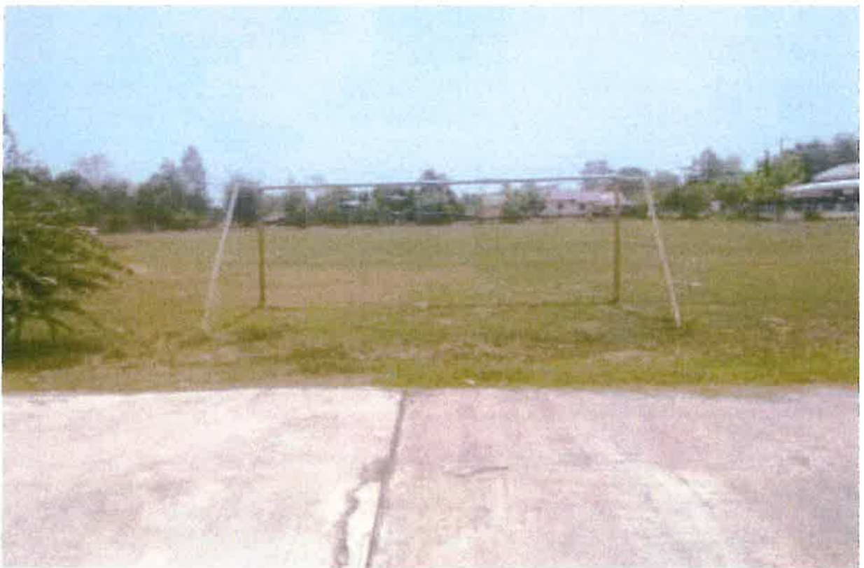
สนามกีฬาบ้านวังโน หมู่ ๒ ตำบลหนองโพธิ์