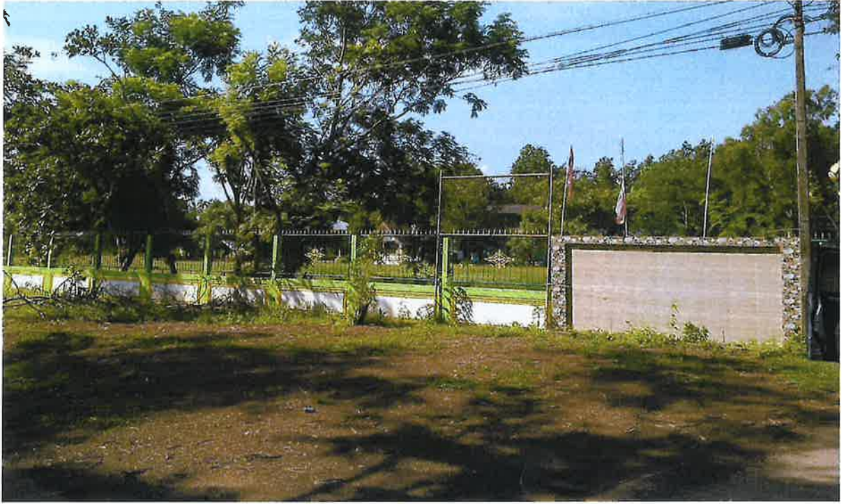
สนามกีฬาบ้านนาขามใต้ หมู่ ๗ ตำบลวังยาง