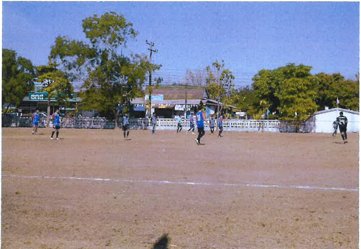
สนามกีฬาบ้านวังยาง หมู่ ๑ ตำบลวังยาง