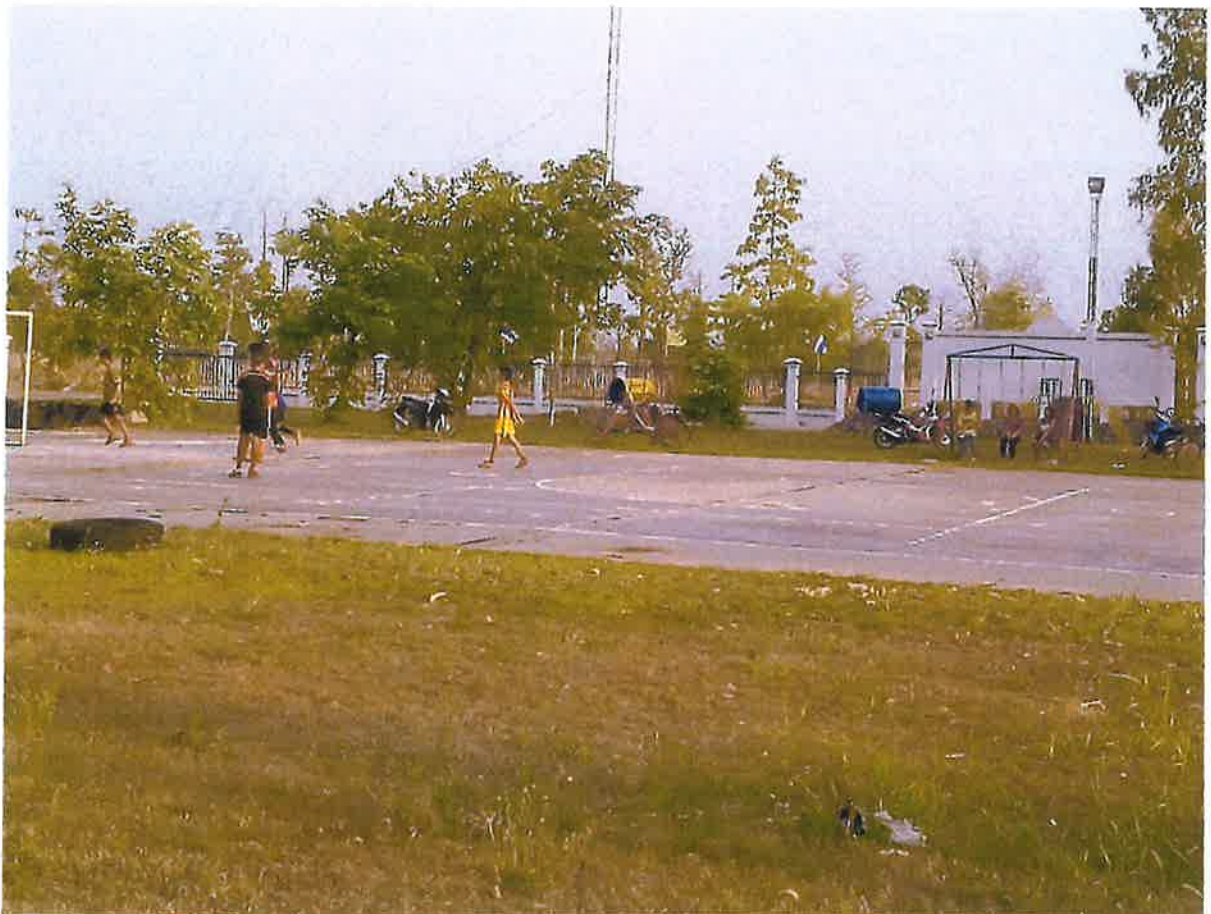
ลานกีฬาอบต.วังยาง