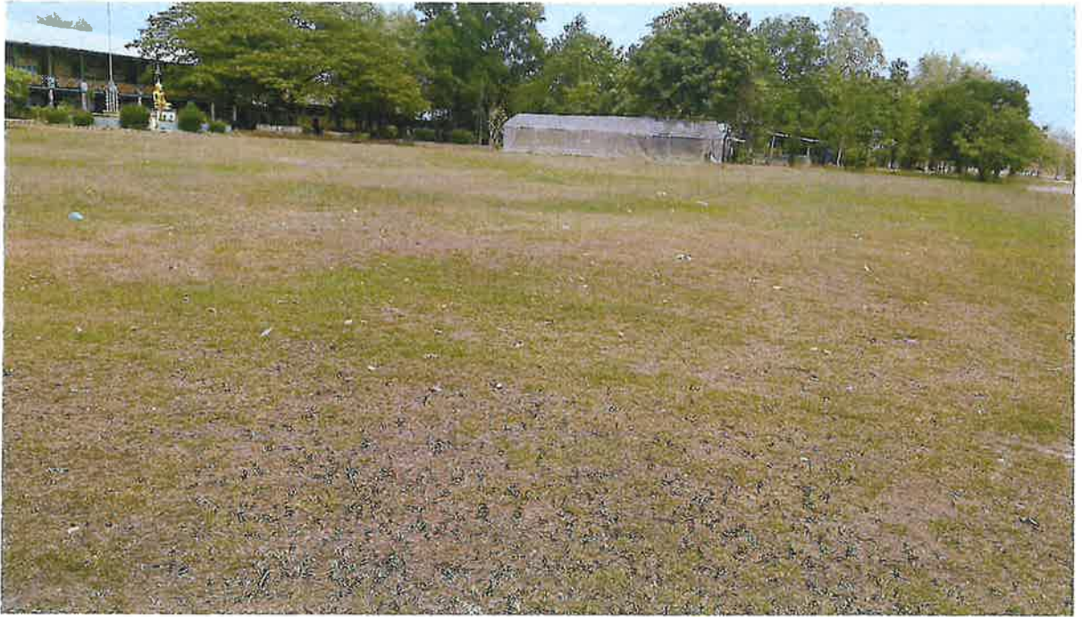
สนามกีฬาบ้านหนองสะโน หมู่ ๓ ตำบลวังยาง