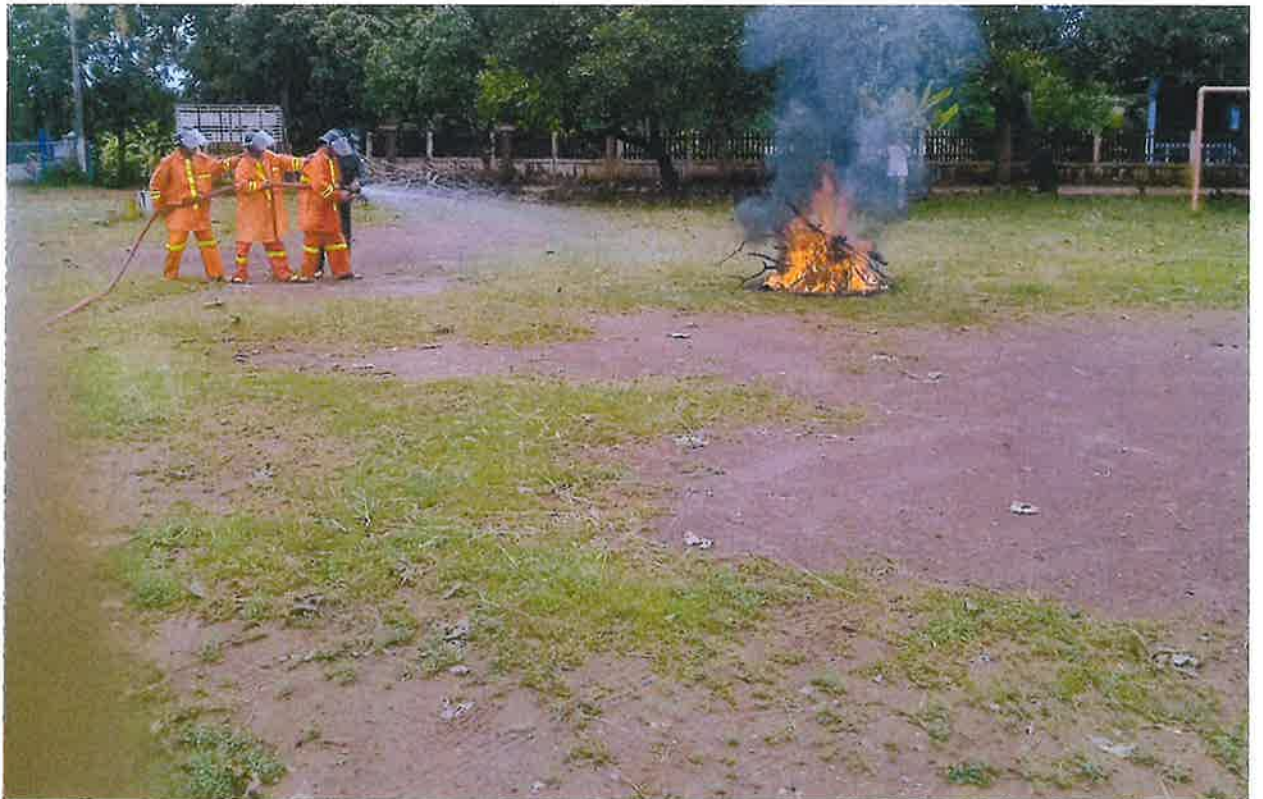
สนามกีฬาบ้านโพนสว่าง หมู่ ๓ ตำบลหนองโพธิ์