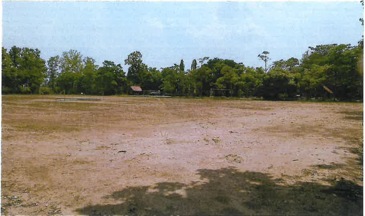
บ้านสามแยก หมู่ ๖ ตำบลวังยาง