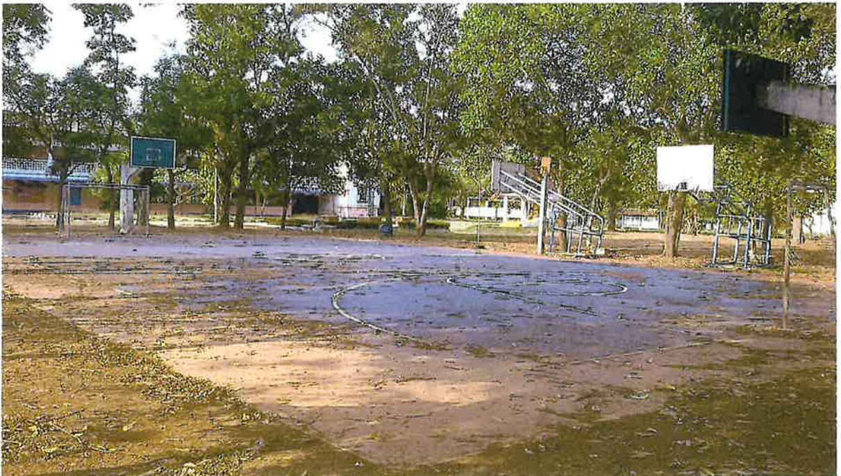
สนามกีฬาบ้านหนองโพธิ์ หมู่ ๔ ตำบลหนองโพธิ์