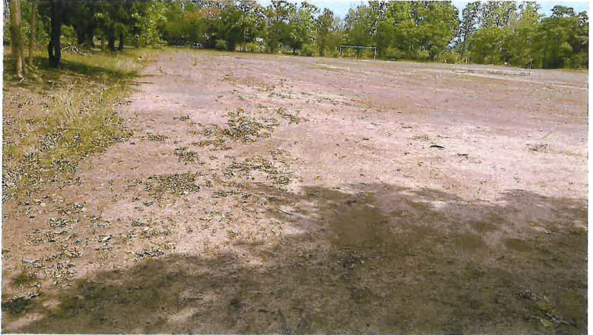
สนามกีฬาบ้านหัวภูธร หมู่ ๕ ตำบลวังยาง