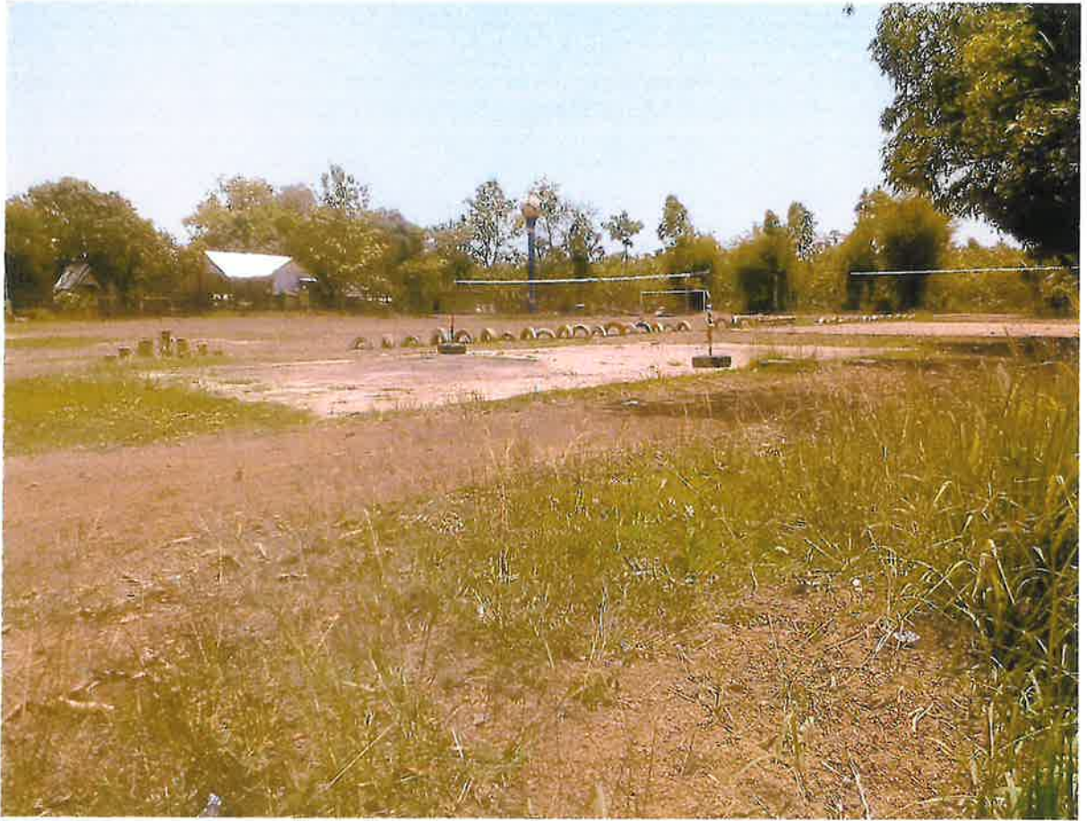
ลานกีฬาบ้านใหม่ไทยเจริญ หมู่ ๙ ตำบลวังยาง